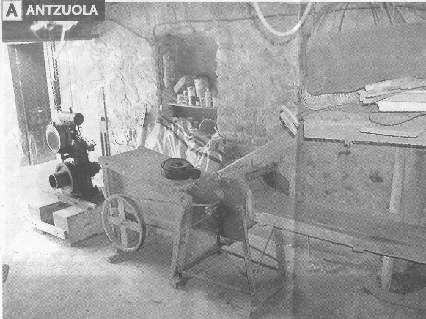
MAKINERIA. Horrelakoak erabiltzen zituzten garai batean nekazariak, garia mozteko. BERRIA